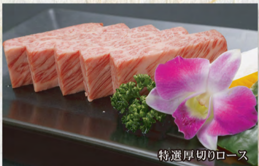
特選厚切りロース